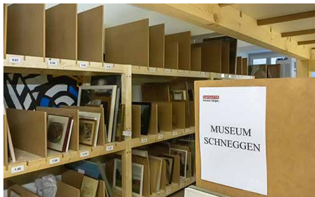
Erweitertes Depot im Saalbau-Keller ▲